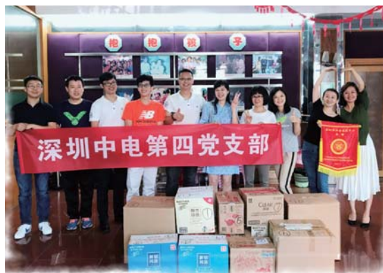
(产业互联网事业部 严楠颖/文)